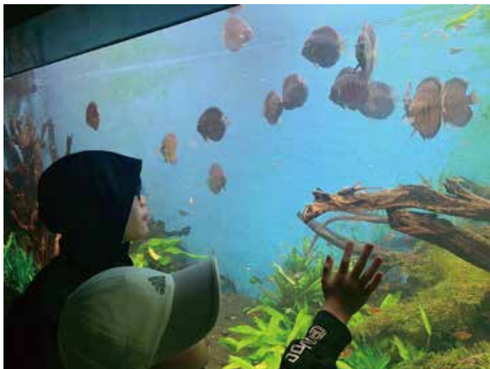
▲生活多元 探索活動海洋生物