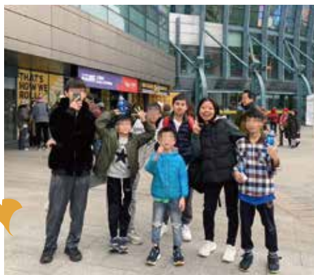
▲生活多元 小巨蛋溜冰