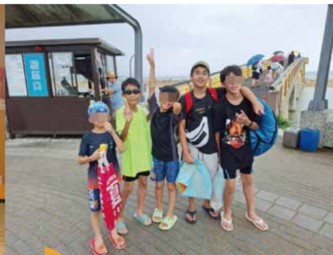
▲福隆海水浴場看沙雕