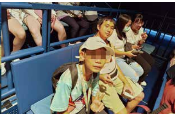
▲參訪觀看果陀劇場