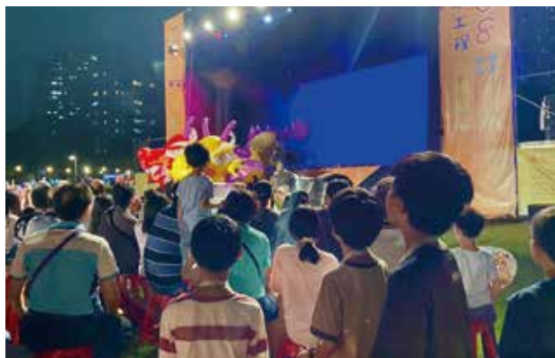
▲院童觀看紙風車劇團