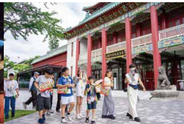
▲體驗教學 歷史博物館