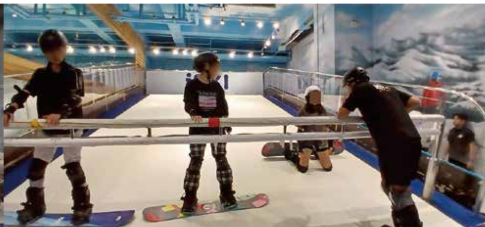
▲生活多元 滑雪體驗