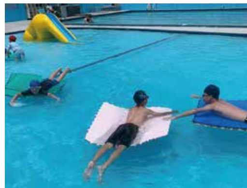
▲生活多元 天母泳訓課程