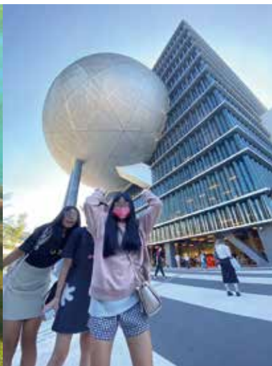
▲生活多元 臺北表演中心