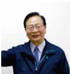
立法院立法委員 林德福

榮光一路走來，守護著孩子們的笑容與夢想，這份精神令人敬佩。老師們的辛勞是最堅強的後盾，孩子們的努力是最動人的故事。願大家以感恩為力量，以夢想為方向，勇敢突破困難，將來成為能幫助別人的人。相信榮光的孩子，一定能把愛傳得更遠。