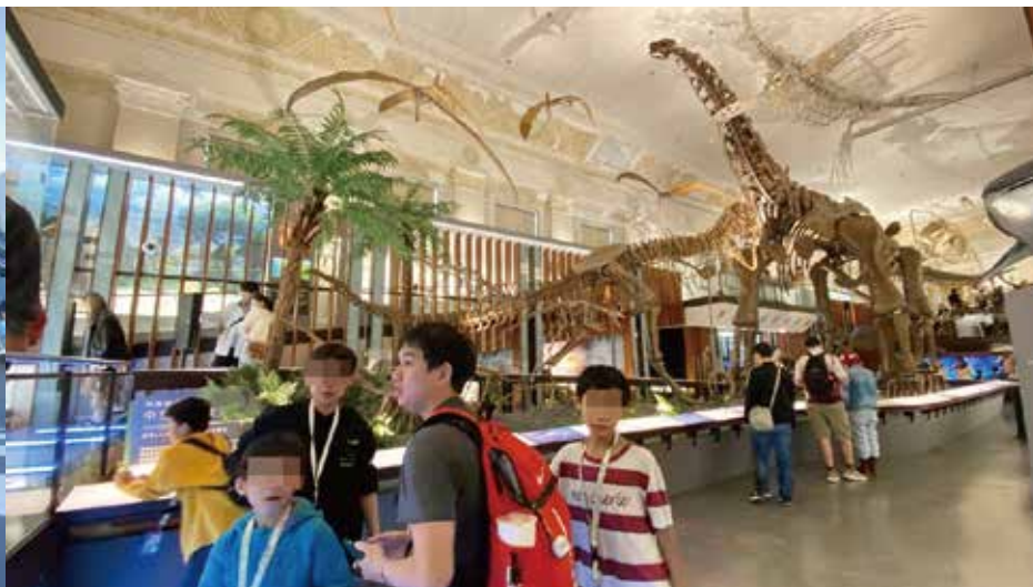
▲生活多元 博物館展