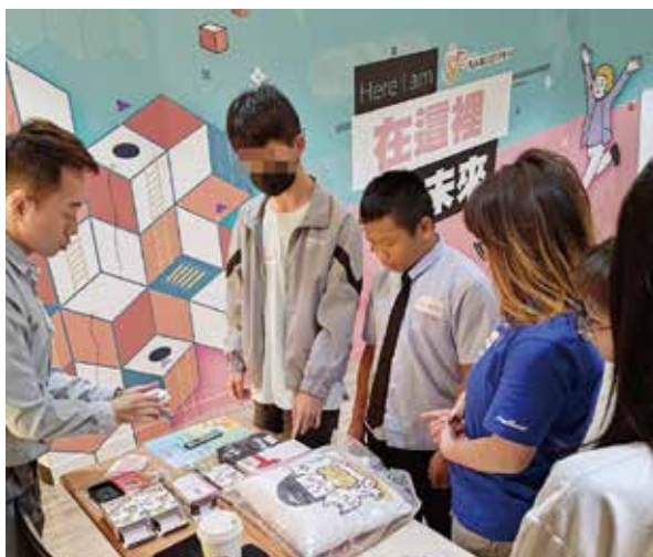
▲院童YS職涯中心體驗