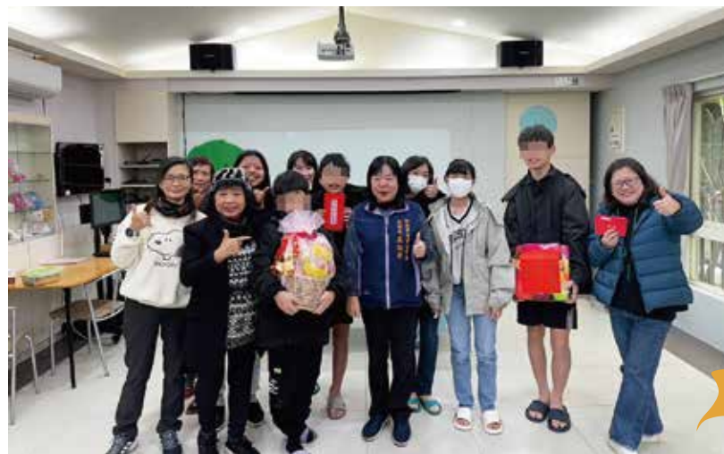
▲社會局 吳副局長及劉科長關懷院生