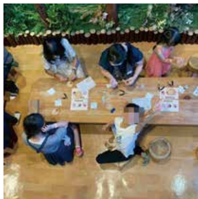
▲草木園地探索營隊