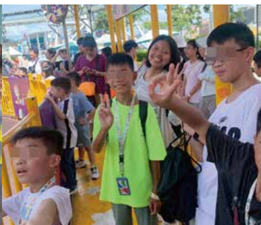
▲院童參訪兒童新樂園