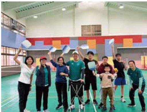
▲體驗匹克球-永和頂溪