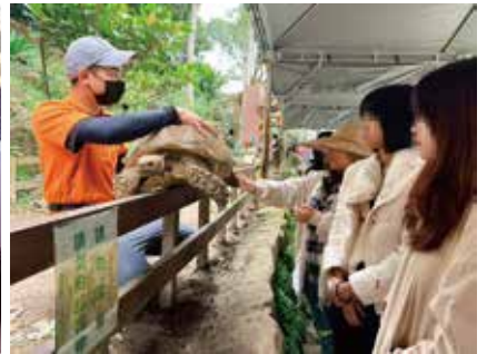
▲師生到向日農場生態體驗