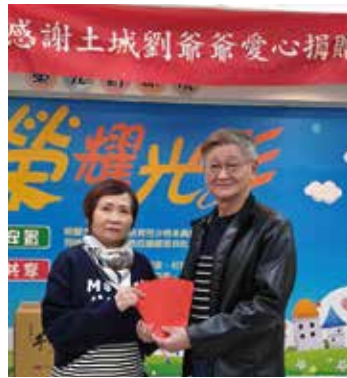
▲土城劉爺爺暨愛心人士 共同捐贈院童壓歲錢