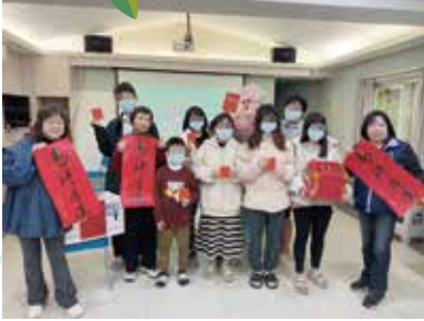
▲新北市政府社會局歲末關懷院生

誠摯感謝這許多愛心企業與社會團體捐贈物資善款默默支持我們， 將關懷與溫暖帶給本院師生，拋磚引玉也將慈愛帶到這社會讓恩典滿溢。