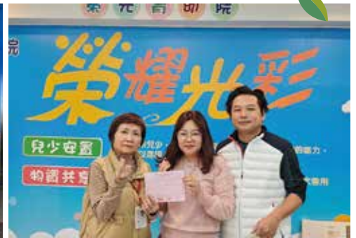
▲玉鳳軒捐贈歲末紅包善款