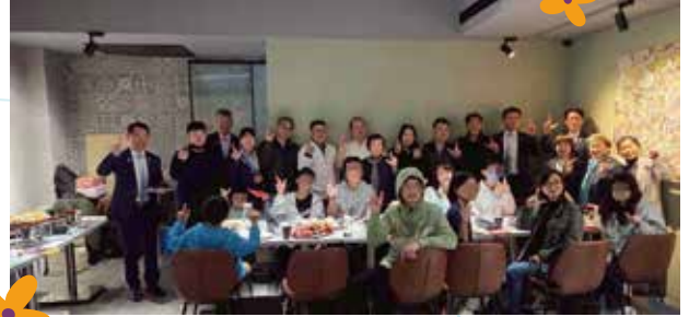
▲碩華扶輪BONA餐館邀請師生晚宴