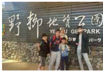
▲野柳海洋公園+地質公園一日遊