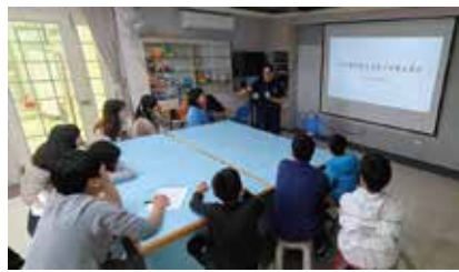
▲基隆地檢吉保護官來進行安全教育