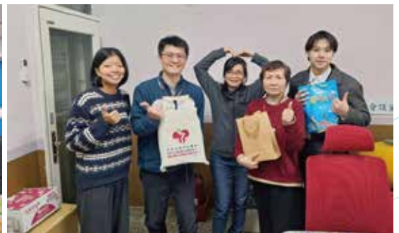
▲新北市永和社福中心拜訪