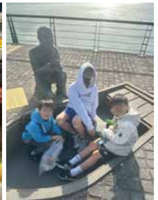
▲師生淡水與馬偕博士合照