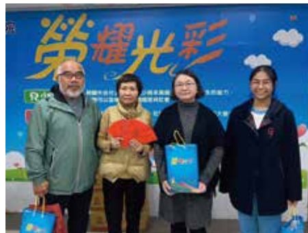
▲格致中學葉主任簡老師學生捐贈小紅包