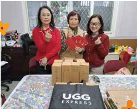
▲喜仕達公司捐贈保溫瓶