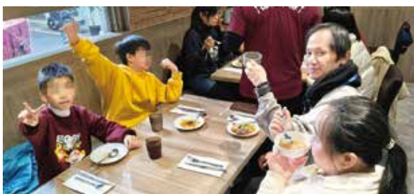
▲自辦年底員工尾牙師生同樂