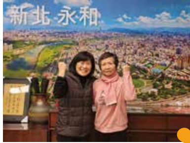
▲區長分送師生小小紅包