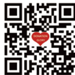
愛心捐款 QR code