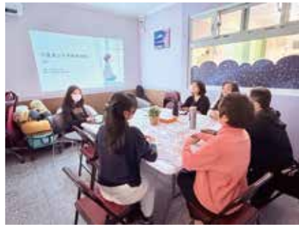
▲院內個案研討-慈濟醫師心理師