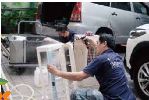
▲生華科技免費公益清洗冷氣設備