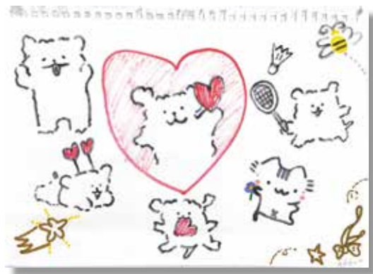
▲院生 / 小明，畫作：小白熊運轉中