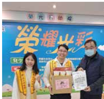
▲佛光山捐贈師生臘八粥