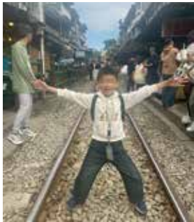
▲共遊遊十分平溪老街