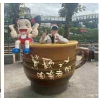
▲院童鶯歌隨走自由行