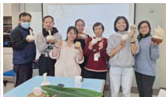
▲同仁學習精油舒壓中藥草球