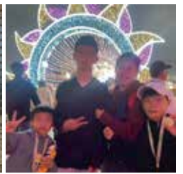
▲師生共遊遊新北燈會