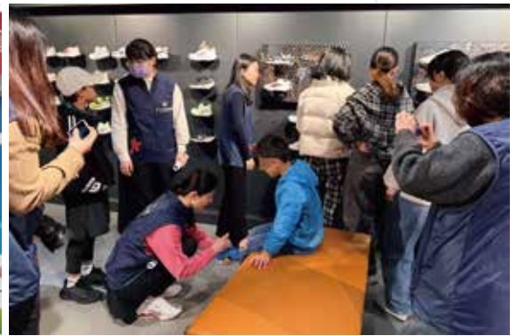
▲元大幸福日捐贈院童運動鞋衣褲