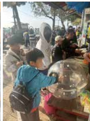
▲院童淡水街頭自助遊