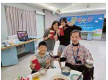
▲除夕圍爐師生同樂