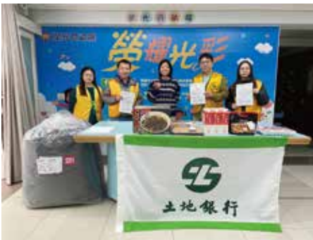
▲土地銀行華江分行與東板橋分行捐贈物資