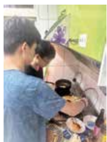
▲院生假日共廚準備晚餐